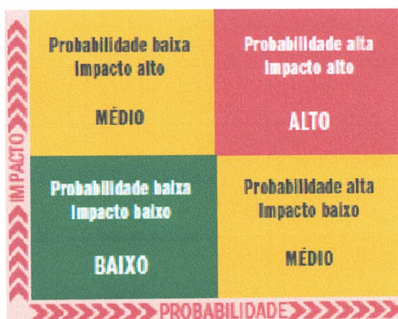
Figura 01 - Matriz de riscos simples

12.1.3. Para a análise de risco será utilizado o método qualitativo, que define o impacto versus probabilidade e, também o nível da escala de risco por qualificadores numéricos que determinarão o método qualitativo como: BAIXO, MÉDIO, ALTO, EXTREMO, facilitando com base na percepção das pessoas para análise. A relação entre os riscos e os seus componentes pode ser ilustrada por meio de uma matriz que se correlaciona com as variantes impacto e probabilidade; segue-se a imagem abaixo: